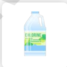
Traitement chimique des surfaces infestées