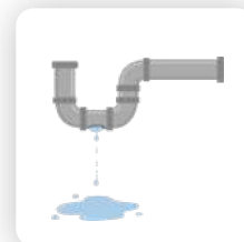
Réparations des fuites d'eau

Les entreprises DUO-DIAG qui assurent cette prestation :