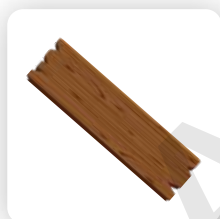
Remplacement du bois endommagé